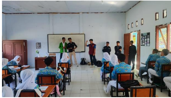
Gambar 3. Proses Pengenalan Energi Terbarukan di SMAN 1 Palibelo

peningkatan kebijakan pro-investasi diharapkan dapat mempercepat transisi energi menuju net zero emission pada 2060.