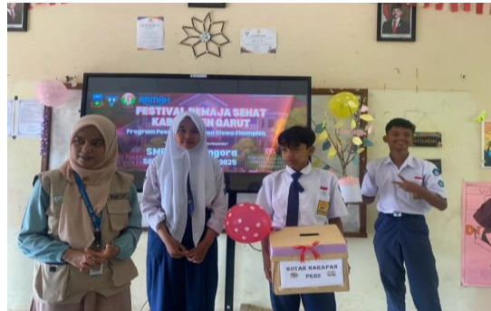
Gambar 4. Kegiatan Festival Remaja Sehat di SMPN 3 Kadungora

kesehatan mental remaja. Para siswa menunjukkan keberanian untuk berbagi pengalaman pribadi, sementara guru mengapresiasi pendekatan kreatif mahasiswa dalam mengangkat isu yang relevan dengan kehidupan remaja. Tahap pelaksanaan sejalan dengan apa yang dijelaskan Felani (dkk., 2025) karena mencerminkan prinsip PAR, yakni menjadikan siswa sebagai subjek aktif dalam proses pembelajaran, bukan sekadar objek penerima informasi.