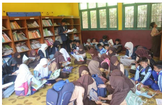
Gambar 3. Kegiatan literasi di SDN Tanggulun

Dengan demikian, kegiatan Safari Berkisah tidak hanya menjadi bagian dari pelaksanaan program, tetapi juga mencerminkan implementasi pembelajaran yang berbasis pengalaman ( experiential learning ), di mana siswa belajar melalui interaksi langsung dengan media dan lingkungan belajar. Hal ini memperkuat bahwa program yang dilaksanakan telah sesuai dengan prinsip SISDAMAS yang mengedepankan pendekatan partisipatif dan pemberdayaan dalam proses pendidikan.