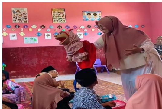
Gambar 2. Kegiatan Safari Berkisah di TK Al-Munasyifa

Di TK Al-Munasyifa, mahasiswa mengadakan kegiatan Safari Berkisah bekerja sama dengan Lembaga Yatim Mandiri. Kegiatan ini menghadirkan juru kisah yang menggunakan boneka sebagai media bercerita, dengan tema utama berbagi dan hidup rukun sesama teman. Anak-anak tampak antusias dan terhibur, sementara guru TK menilai kegiatan tersebut membantu pengembangan imajinasi serta pembelajaran nilai sosial. Program ini sejalan dengan pendekatan act dalam PAR, karena mahasiswa tidak hanya menghadirkan inovasi, tetapi juga terlibat langsung dalam mengkondisikan suasana belajar yang menyenangkan.