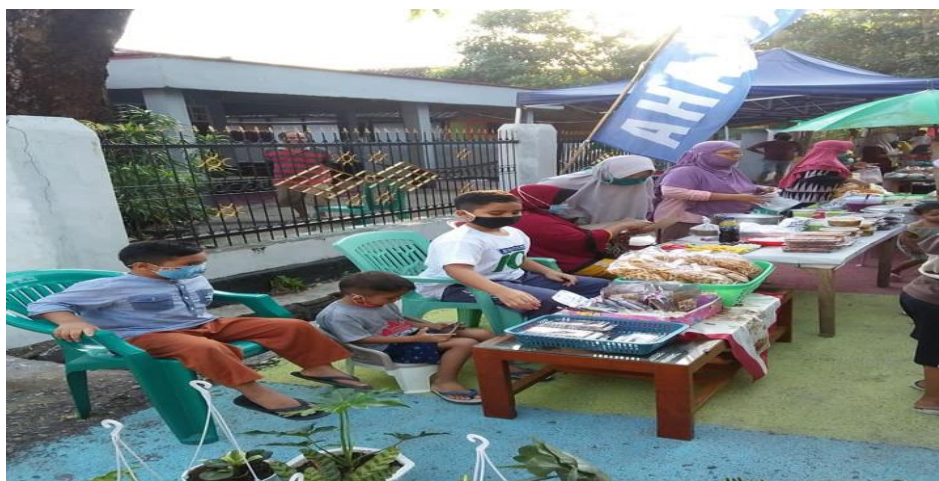
Gambar 3. Kegiatan Pasar Pelangi