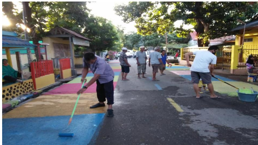
Gambar 2. Kegiatan Persiapan Pasar Pelangi