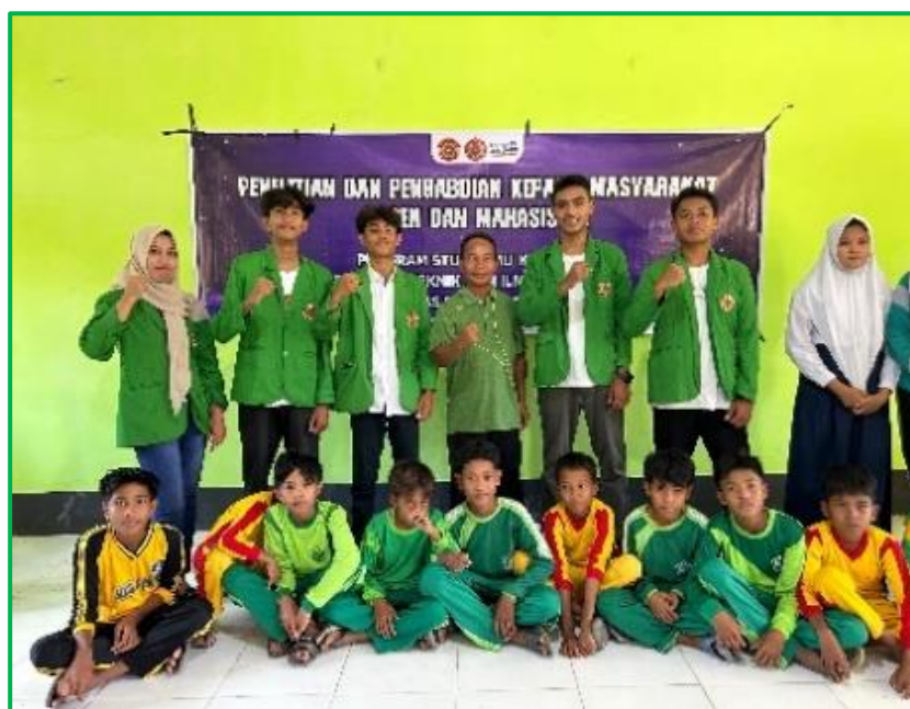
Gambar 3 Sesi Foto Bersama.

Tahapan pelaksanaan dari kegiatan ini adalah dengan memberikan sosialisasi dan pelatihan kepada siswa dan siswi SMP (Martini Dwi Endah Susantia a, 2022). Kegiatan pengabdian ini dilakukan pada tanggal 15 Mei 2024 yang mana melibatkan pihak siswa dan guru pendamping di SMP 9 SATAP desa Wora. Kegiatan berlangsung dengan paparan materi langsung. Dalam pelaksanaan dan penyampaian materi kepada siswa/i, terlihat siswa/i sangat intuisi dalam memahami apa yang sedang di sampaikan oleh pemateri. Pada gambar 1. dokumentasi sesi foto bersama siswa sebagai bentuk peruntukan dari kegiatan PKM ini.